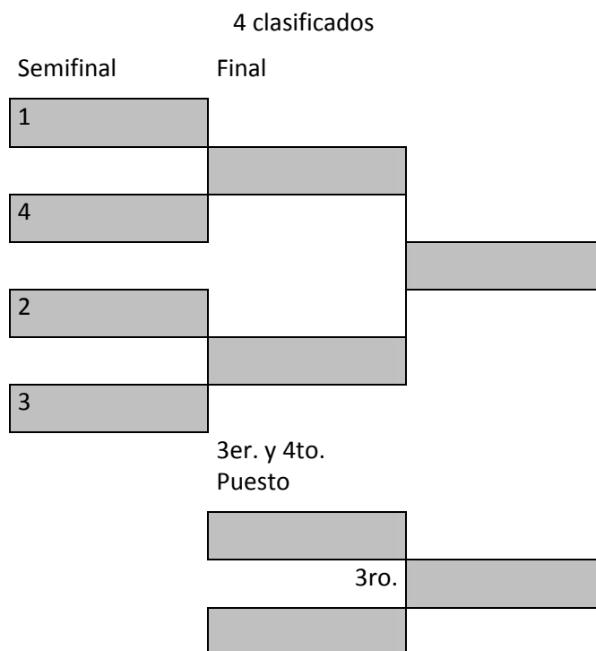
Figura 1: El orden de salida para las otras etapas de la ronda final con 16, 8 y 4 competidores respectivamente

(El competidor con una posición más elevada en el esquema de cajas, siempre se pondrá en marcha en la Ruta 1)